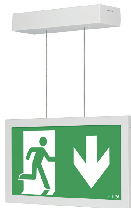
Infinity II - W