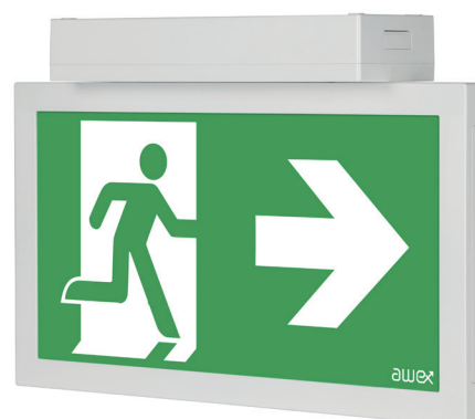
Infinity II - T

Vi förbehåller oss rätten till konstruktionsändringar.