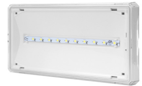
EXIT SR smalstrålande